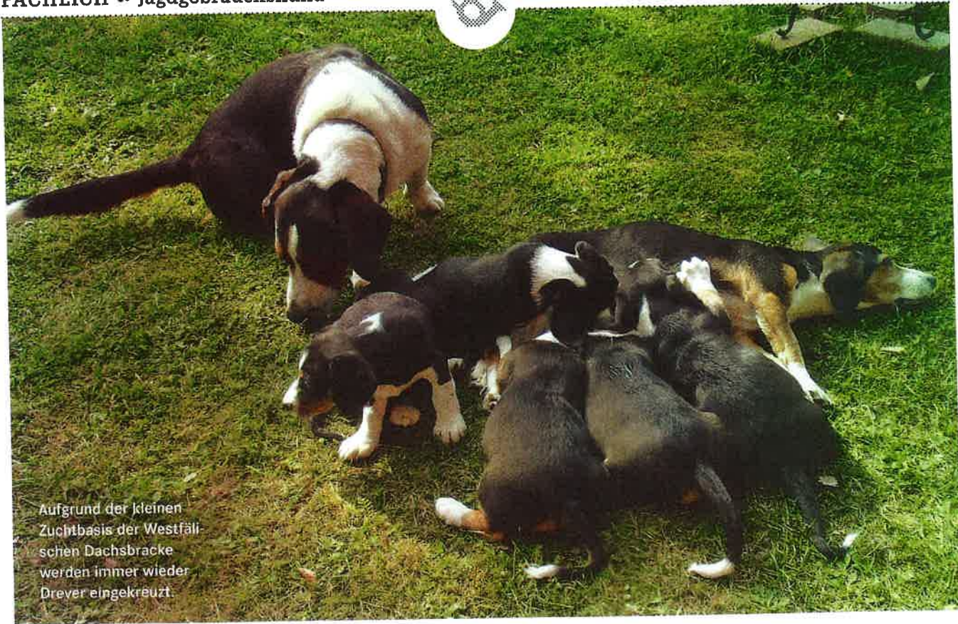
Aufgrund der kleinen Zuchtbasis der Westfälischen Dachsbracke werden immer wieder Drever eingekreuzt.