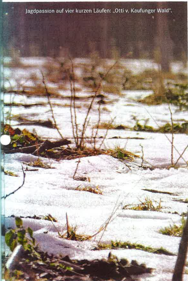
Jagdpassion auf vier kurzen Läufen: „Otti v. Kaufunger Wald“.