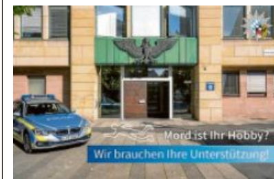
Mit diesem Bild wirbt die mittelfränkische Polizei um Verstärkung.